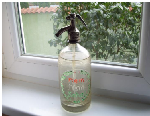
10. kép. A Topolyai család feliratos szódásüvege.

Az egyes tárgyak elsődleges tartalmuk, anyaguk, technikájuk, formájuk, stílusuk, funkciójuk révén vannak jelen a világban, ám rendelkeznek szimbolikus jelentéssel is, melyek az értő közösség számára többletjelentést hordoznak. (Boglár 2002) Itt kell megemlítenünk a szódásüvegeket, melyeket osztályozhatjuk méretük, színük, formájuk és díszítésük alapján. Megmunkálásuk lehetett domborműves, festett, homokfúvatott vagy mindhárom egyszerre. Formaviláguk is változatos képet mutat, hiszen csepp, szoknya, körte, kétgömbös és váll alakú szódásüvegek egyaránt használatosak voltak (Kiss 2008). Bálint Sándor Szegedi szótárából megtudhatjuk, hogy a szódásszifon szegedi elnevezése a kánya, ami a szódásüveg formájára és a márdárfejes csövekre utal. [7] Az idők folyamán a szódásüvegek többféle változáson mentek keresztül, ugyanakkor funkcionális jegyeiket megőrizték.