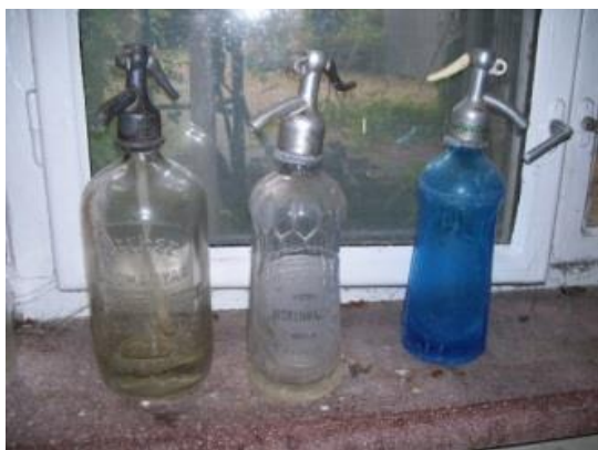
11-12. kép. A Topolyai Szikvízüzem alumínium és műanyag fejes illetve cégfeliratos szódásüvegei.

A szikvízkészítés fő eszköze, a szódás gép vagy másképpen szódátöltő gép elsősorban az eladásra váró üres üvegek megtöltésén keresztül jelképezte a megélhetés biztonságát a családunknak. Dédapám gyermekkorában a szódásgépet még kézi erővel, a nagykerékbe illeszkedő hajtókar segítségével kellett mozgásba hozni. Mindeközben természetesen arra is figyelni kellett, hogy a villanymotor kiálló vastengelyén és a hajtókeréken végigfutott bőr hajtósíj kellően meg legyen faggyúzva, hogy le ne essen. Egyfajta modernizációt jelentett a fényes acél keverőhenger, melybe egyik oldalról egy nagy réztartályból szivattyú segítségével egy