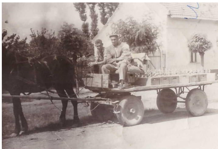
7. kép. Szódakiszállítás az 1960-as években.