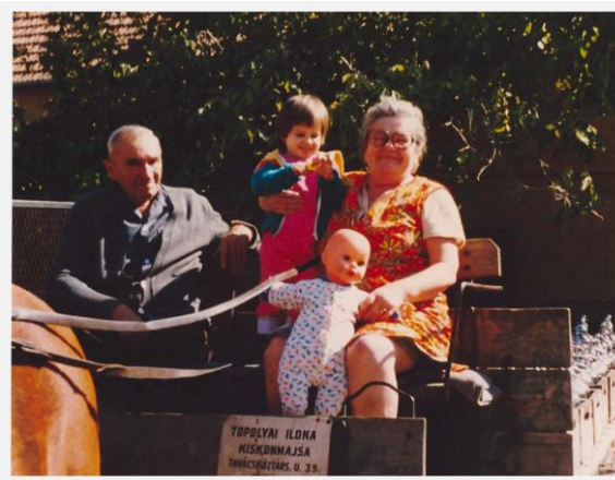
14. kép. Szódakiszállítás az 1980-as évek második felében.

Kijelenthető, hogy a szódagyártás és a kiszállítás a család számára jóval több volt, mint egyszerű mindennapi rutinfeladat: szódásnak lenni egy életformát jelentett, amit csak kellő elhivatottság, szorgalom és kitartás birtokában lehetett igazán jól művelni.