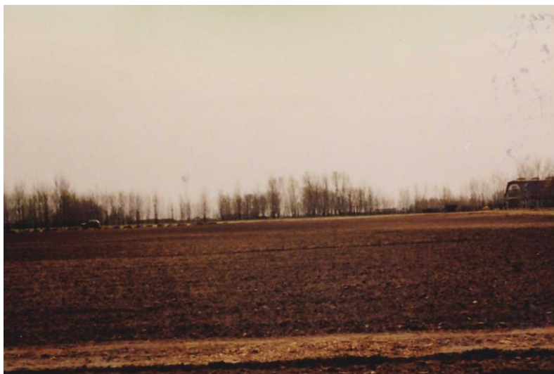
4. kép. A családi birtok Ötfán.