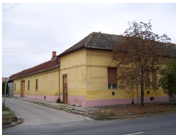
2. kép. A Topolyai család háza Kiskunmajsán, 2013.