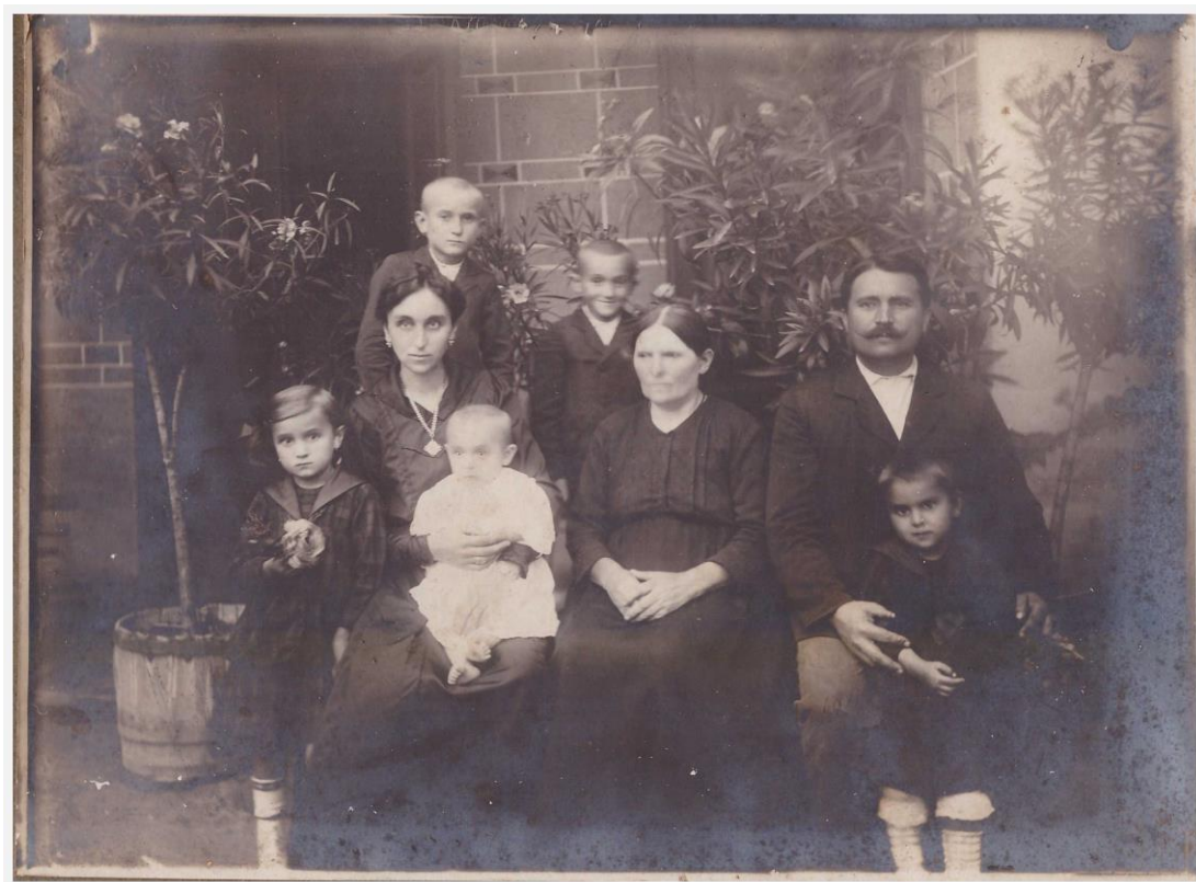
1. kép. A Topolyai család az 1910-es évek végén.

volt. A II. világháború alatt a Szeged-Szőreg határposzton töltött be parancsnoki tisztséget. Fogságba esett, majd az egykoron erős testi felépítésű katonatiszt 5 év után fizikailag teljesen leépülve érkezett haza. Később SZTK-ellenőr lett.