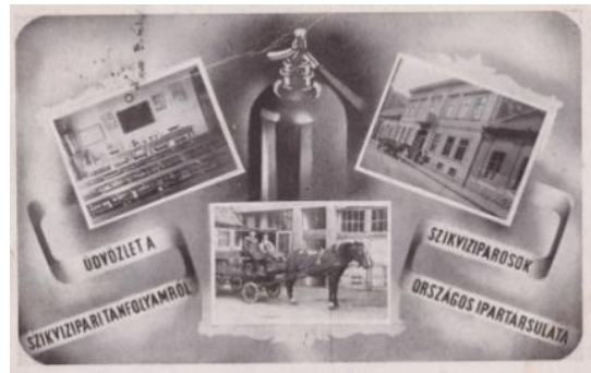
5. kép. Képeslap a szikvízipari tanfolyamról, 1948.